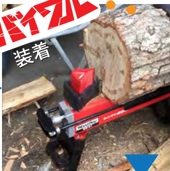
バイワフルがまず、クサビの要領で切込んで行く