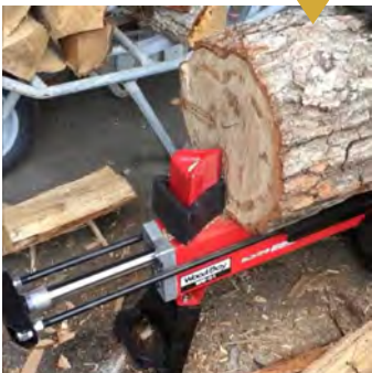
堅い玉切りの縁側に割れのキッカケが