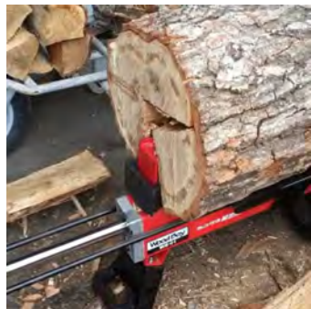
徐々に既存の刃が木を割って行きます