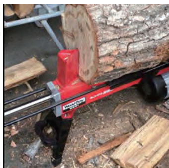
標準の刃で割れない